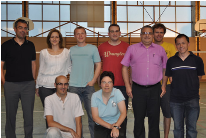
Le bureau actuel, il manque Alain et Antoine sur la photo.

Pour les inscriptions, vous devez redonner tous les papiers dans les 15 jours (liste page suivante) suivant votre première venue. Pour des questions d'assurance merci de respecter ce délai.